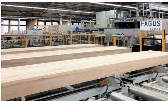
FAGUS_SUISSE_001.JPG Produktionswerk in Les Breuleux. Fertige Träger mit neuer Holzästhetik aus Fagus Stabbuche.

Fagus Suisse SA ist eines der führenden Schweizer Woodtech-Unternehmen im stark wachsenden Holzbaumarkt und technologisch führend in der Laubholzverarbeitung. Gegründet 2014 als nationales Generationenprojekt von mehr als 130 privaten und institutionellen Investoren ist Fagus eines der wenigen Schweizer Rohstoff- und Woodtech-Unternehmen, das privaten und institutionellen Anlegern offensteht (Valor CH0376503491).