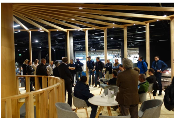
Gut besuchter Buche-Pavillon an der Holz 2016

In den letzten Monaten standen die Marktbearbeitung und vertiefte Marktabklärungen im Zentrum der Arbeiten. Der erfolgreiche Messeauftritt von Mitte Oktober an der „Holz2016“ in Basel widerspiegelt das rege