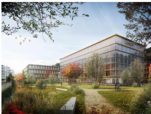
Geplantes Verwaltungsgebäude des Bundes mit viel Buchen-Konstruktionsholz

Die Fagus führt eine Projektliste mit den innerhalb der nächsten Jahre in Holzbauweise geplanten grossen Bauwerken. Darunter sind auch die ersten Hochhäuser mit 9 Geschossen und mehr. In beinahe all diesen Projekten wird aufgrund der statischen Ansprüche Laubholz, im speziellen Buche, in bedeutenden Mengen zum